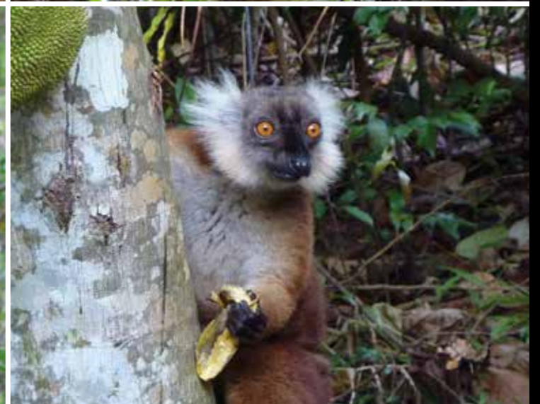
Les lémuriens sont indissociables de Madagascar. Endémiques, plus de 60 espèces y sont aujourd'hui répertoriées.