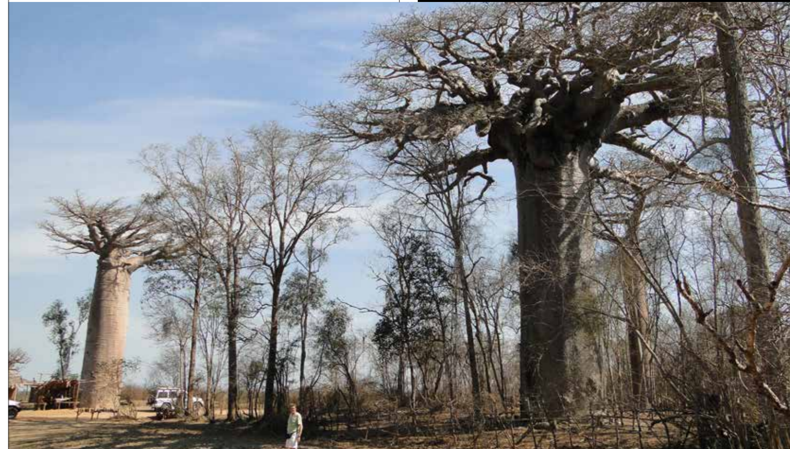
Végétation sèche et forêts de baobabs s'étendent sur plusieurs kilomètres. Cette impression de sécheresse sur la piste rouge qui mène à Bekopaka, accentuée par les fréquents feux de brousse, sera présente pendant tout le trajet