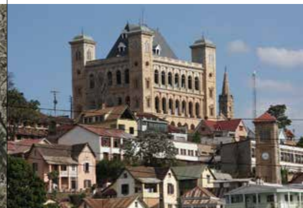
Le Palais de la Reine presque restauré, domine la ville des Mille...