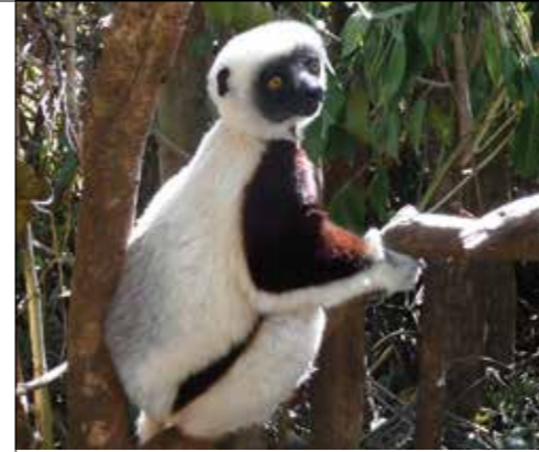
Sifaka de Verreaux (Propithecus de Verreaux), lémurien endémique à Madagascar.

L'accompagnement par un guide accrédité est obligatoire pour visiter les Tsingy. Chaussures de marche, bouteille d'eau, vêtements légers, lampe torche, sans oublier le chapeau et la crème solaire... Et vous êtes équipés pour la balade !