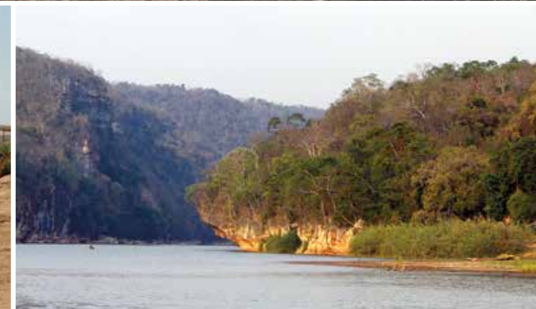
Pas de doute, on fait partie intégrante des tableaux... mouvants. Le soleil donne une couleur différente à chaque heure de la journée aux gorges du fleuve... Une balade en pirogue sur un fleuve du bout du monde.