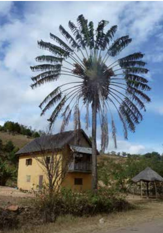
L'arbre du voyageur, ou ravinala (son nom malgache) est une plante tropicale originaire de Madagascar. Les malgaches l'ont baptisé ainsi du fait que l'eau conservée à la base de ses feuilles permet au voyageur de se désaltérer.