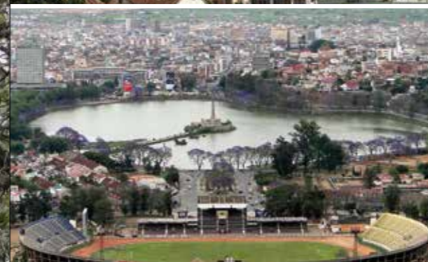
Le fameux lac Anosy et ses jacarandas...