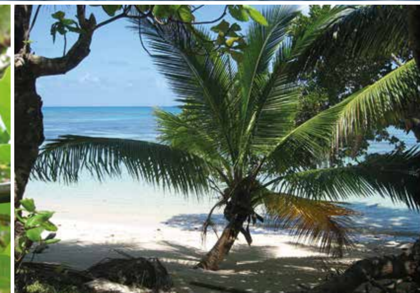
Cocotiers et sable blanc... Au bord de l'Océan Indien.