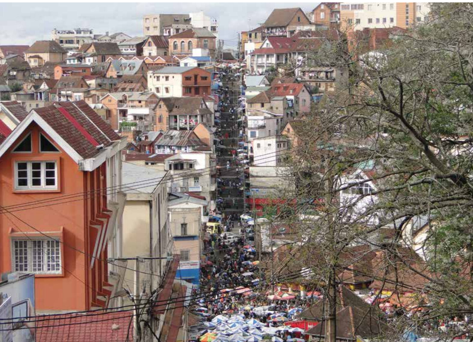
Antananarivo compte plus d'une centaine d'escaliers, des plus sommaires aux plus monumentaux selon les dénivellations et les quartiers desservis. Ici le quartier "toto-baton'Antanarenina".