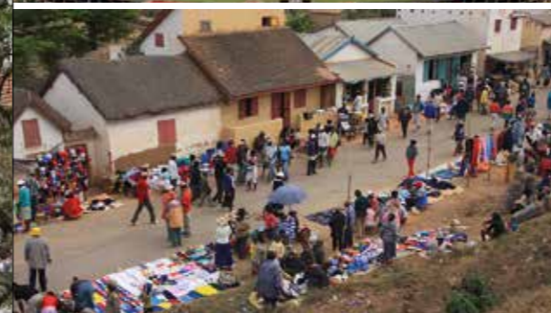
Petit marché de friperies en bord de route.