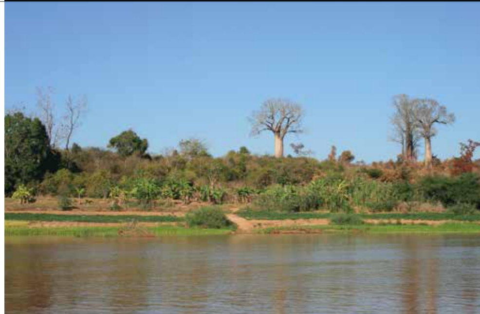
Des forêts de baobabs... Sur les huit espèces de baobabs recensées sur la planète, sept ne se trouvent qu'à Madagascar... sauf que depuis cette année 2013, les 8 espèces ornent le jardin extraordinaire de Singapour...