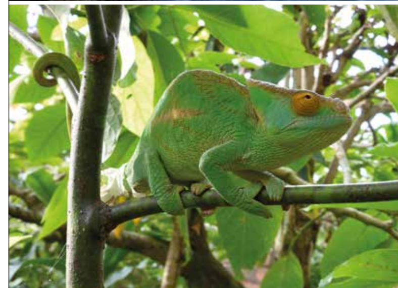
Quelle émotion submerge ce caméléon pour nous offrir cette magnifique couleur verte de l'arbre qui l'abrite ?