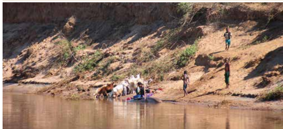
Les bords du fleuve Tsiribihina sont des lieux de rafraîchissement où hommes et zébus offrent aux regards les scènes typiques de la vie quotidienne.