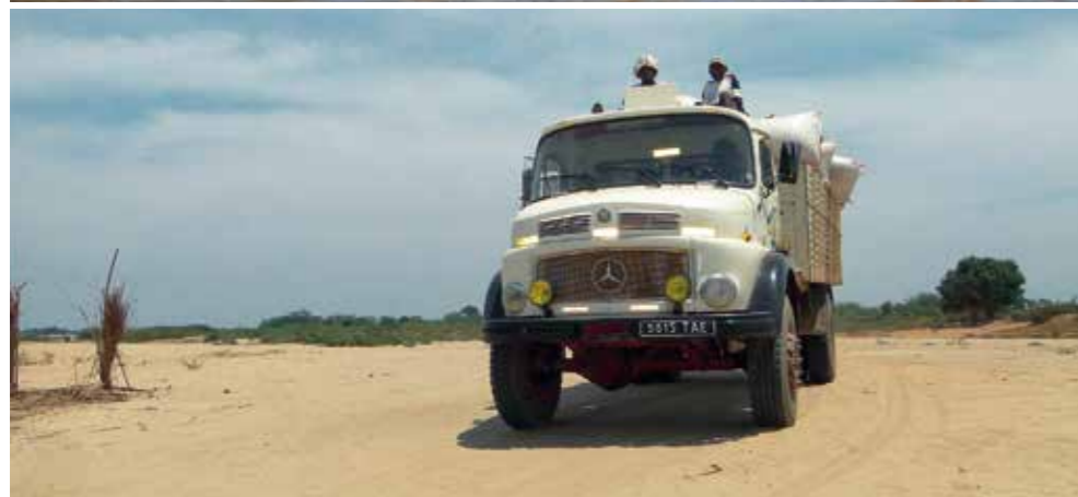
Les vivres et autres nécessités pour les hôtels arrivent par camion à travers la piste à destination de Bekopaka.